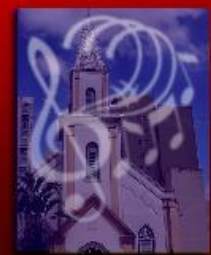
Ministério de Louvor da Igreja Metodista Central de Londrina